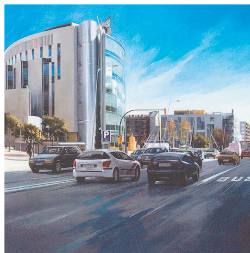
JUAN RAMÓN ESPAX: "COTXES PER TERRASSA". Con un estilo casi hiperrealista, Juan Ramón Espax (Aitona, 1949) realizó esta panorámica de la Rambla d'Ègara, protagonizada por el edificio de Caixa Terrassa y los vehículos en marcha. Es un artista en activo desde la década de los setenta, que en 2007 ganó el premio Arts Andorra.