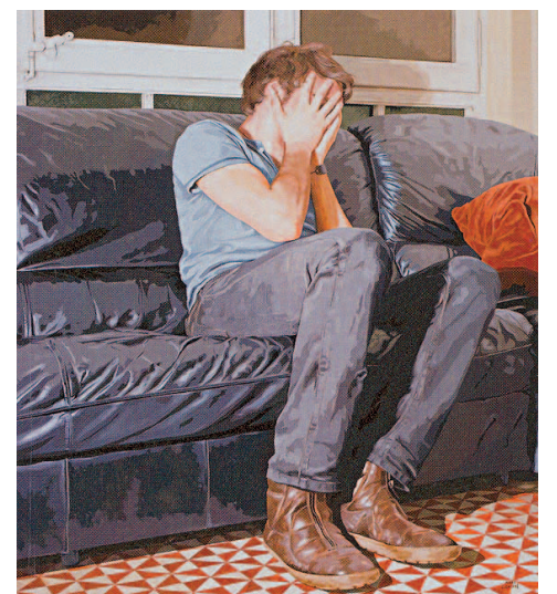
MARC FIGUERAS: "BARCELONA-BERLÍN". El hiperrealismo "clásico" también está representado en la exposición con esta angustiada figura de Marc Figueras (Barcelona, 1981). Figueras es un habitual participante del "Hipermerc'art" de la sala Vinçon. Su última exposición ha sido este mismo año en la galería Jordi Barnades.

Muchos te pueden ofrecer un coche por menos. Pero muy pocos con más.